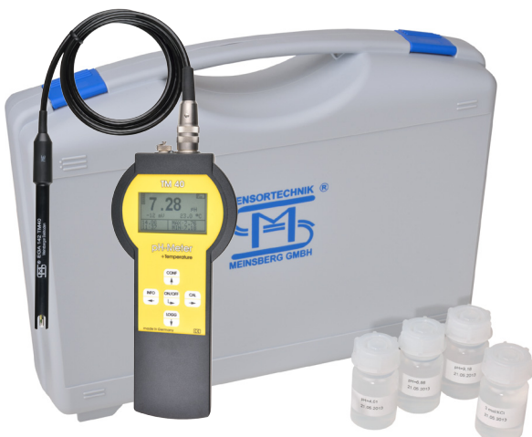
TM40/Set mit pH-Sensor EGA142-K010-U-X TM 40/Set with pH Sensor EGA142-K010-U-X