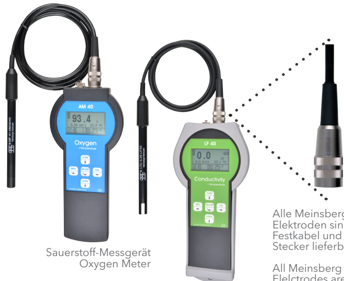
Sauerstoff-Messgerät Oxygen Meter